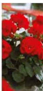
Уређивање школског дворишта – садња цвећа

око липе, а постојеће биљно окружење је освежено. Данима након садње су се исти ученици враћали и на истом месту дорађивали оно што нису урадили или су поправљали постојеће. Ђаци који су учествовали у акцији су били веома задовољни њеним исходом и радују се новој, како због забаве, тако и због саме школе. Али, једна од најбитнијих страна ове активности је у томе што су сви ђаци учествовали, помагали једни другима и уложили своју креативност. Како се овакав вид ученичког ангажовања показао као успешан, накнадно је уведен у План рада Ученичког парламента, као једна активност која би се могла проширити и на остала одељења.