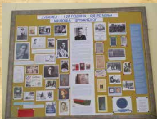
Пославка изложбе поводом обележавања јубилеја – 120 година од рођења Милоша Црњанског, септембар 2013. године