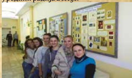
Јубилеј – 200 година од рођења Петра II Петровића Њећоша, децембар 2014. године