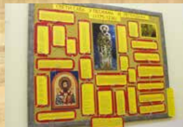
Савиндан – Изложба: Свети Сава у песмама и легендама, јануар 2014. године