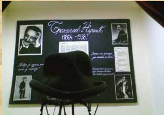
Ове године обележава се 150 година од рођења Бранислава Нушића, поводом чега се подсећамо првог рада секције Млади библиотекарџ, паноа Бранислав Нушић (1864-1938) из 2010. године